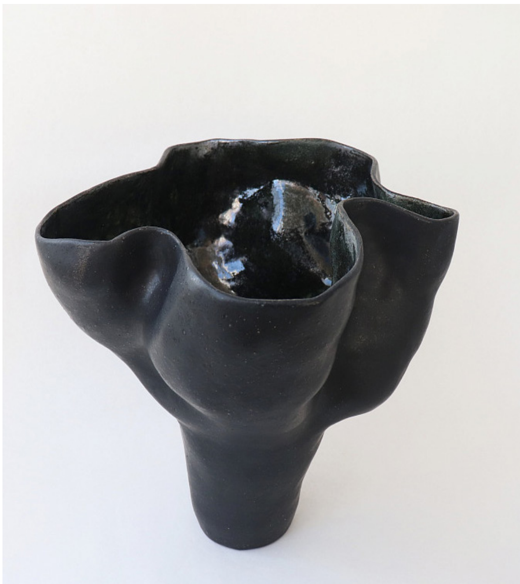
VIOLETTA BORA "BLACK SILK" / Ваза 2024 330 x 330 x 300 mm