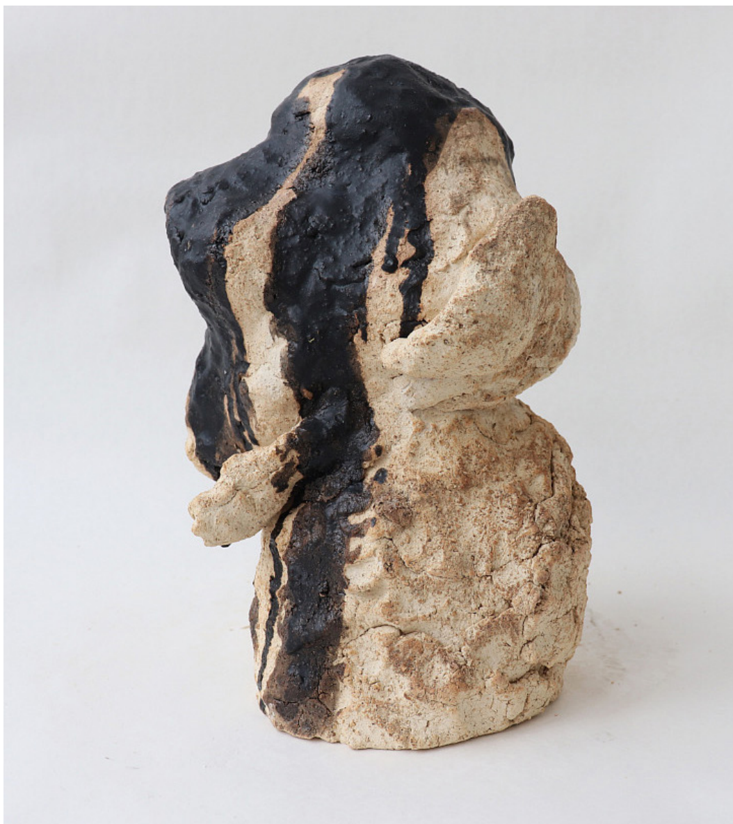
VIOLETTA BORA “KOGDA NEKOMU MOLITSA” / Скульптура 2024 160 x 190 x 280 mm