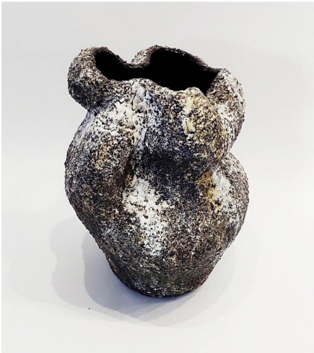
VIOLETTA BORA "BOUCLE" VASE/ Ваза 2024 300 x 300 x 370 mm