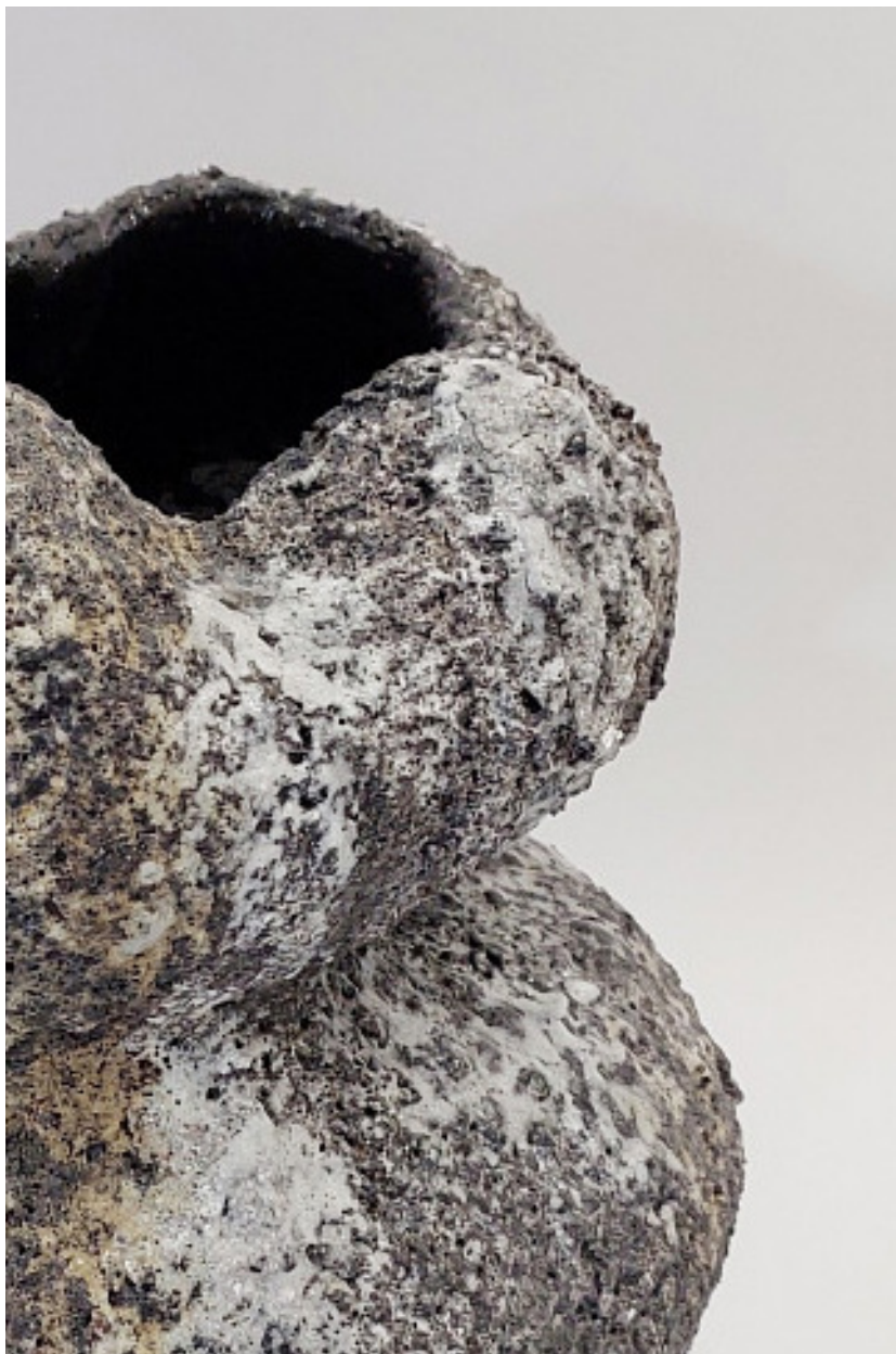
В поисках внутренней опоры: трансформирующая керамика Виолетты Бора