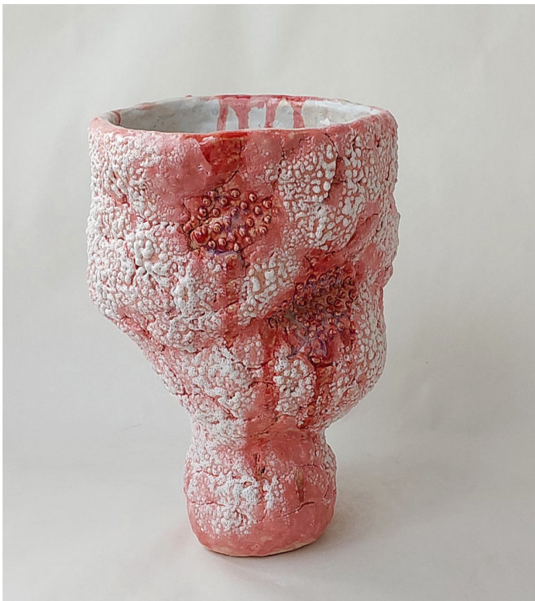
VIOLETTA BORA “BODIPOZITIV” / Ваза 2024 200 x 200 x 310 mm