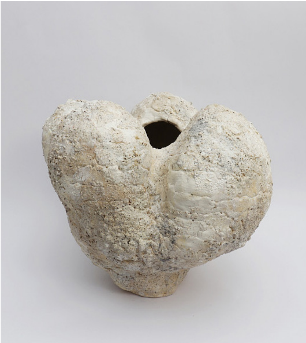
VIOLETTA BORA "BOUCLE WHITE" VASE/ Ваза 2024 370 x 370 x 260 mm