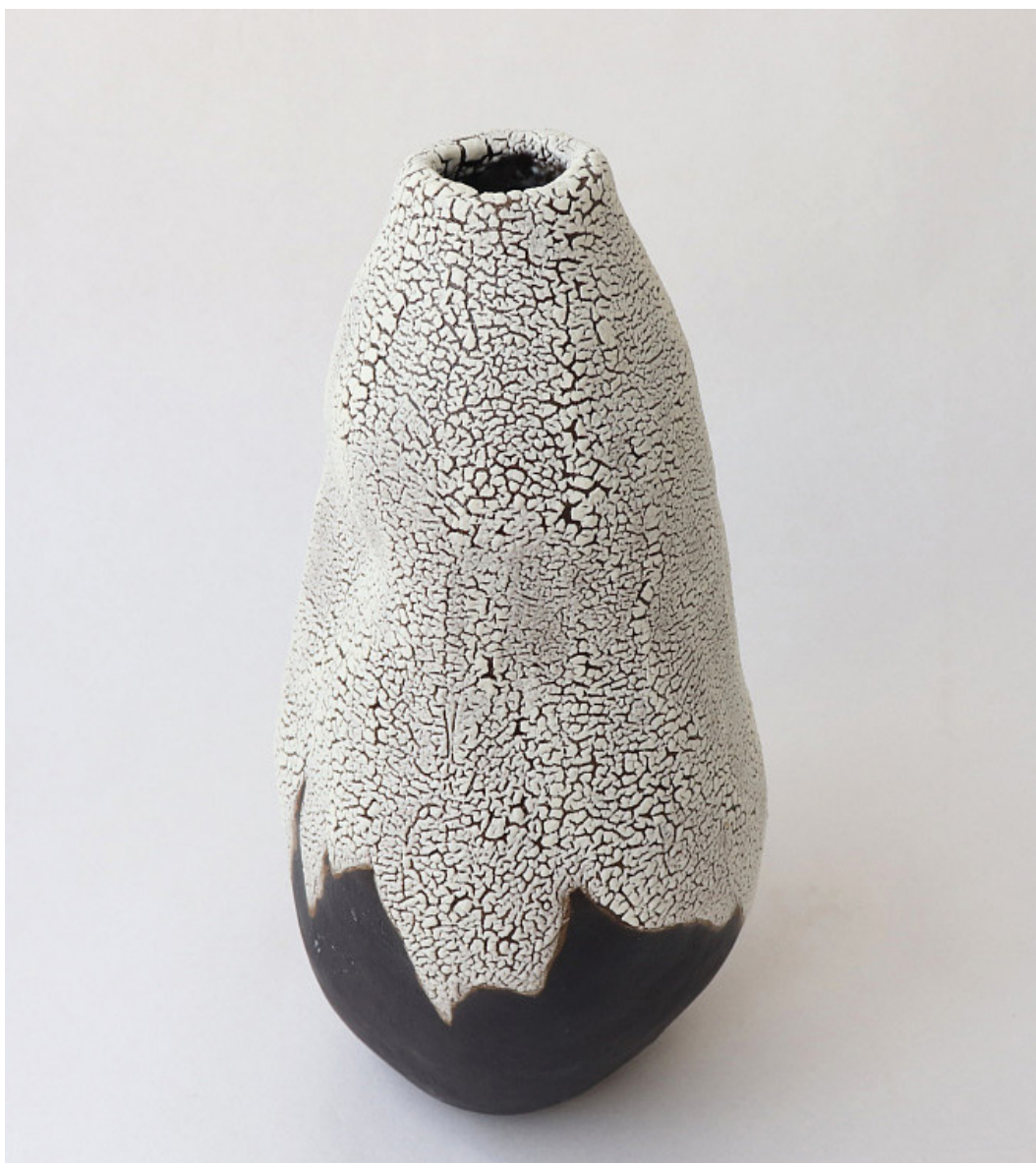
VIOLETTA BORA "TERRA RACHADA" / Ваза 2024 130 x 130 x 250 mm