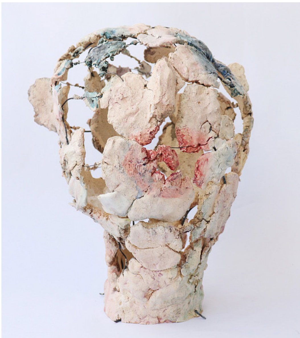
VIOLETTA BORA “SOBERIS TRYAPKA!” / Скульптура 2024 260 x 260 x 300 mm